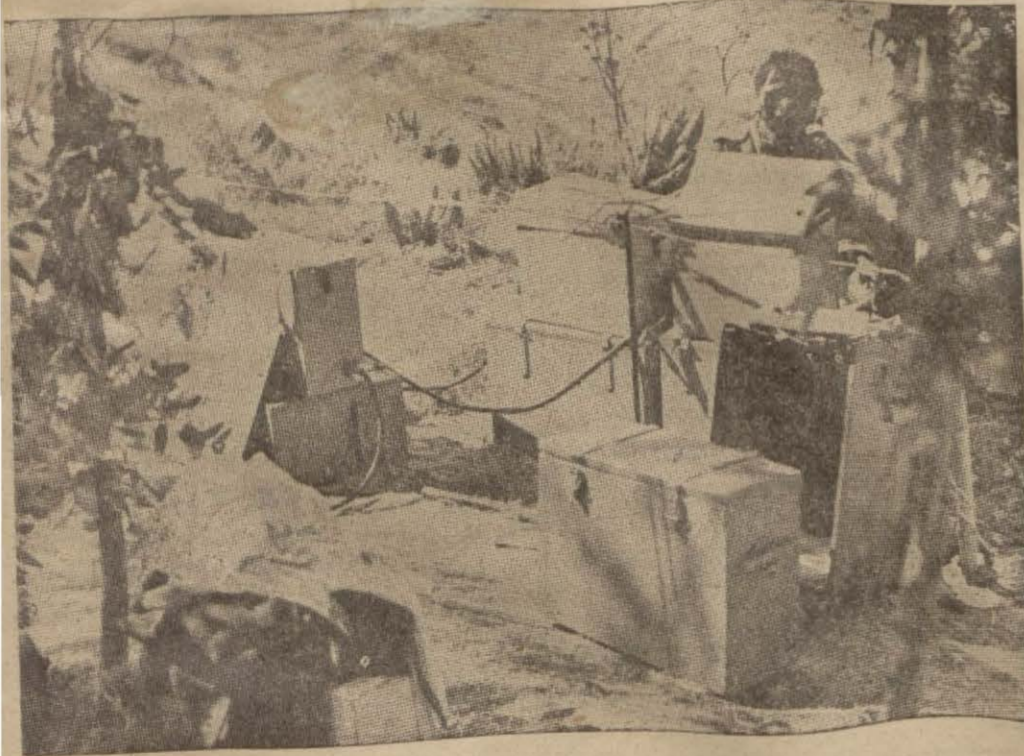
Habeş ordusunda son sistem bir telsiz istasyonu çalışırken

İtalyan Uçakları İsveç Kızılhaçını Bombardıman Etiler