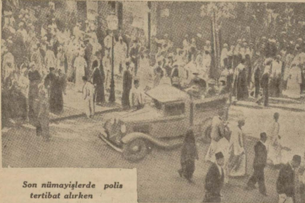
Son nümayişlerde polis tertibatı olurken